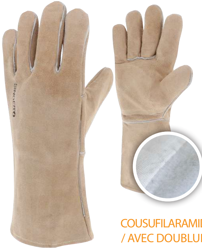
COUSUFILARAMIDE / AVEC DOUBLURE