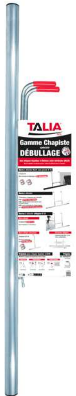
Barre Ø 50mm avec bouchons.

Existe en longueur 150cm (ref. 44 23 32), 200cm (ref. 44 23 33) et 300cm (ref. 44 23 34).