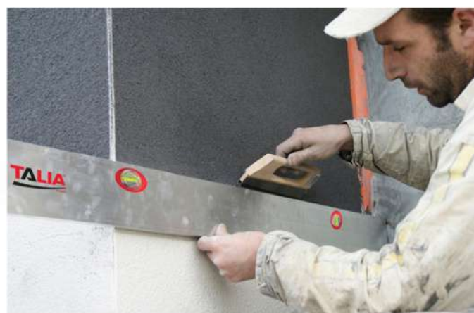
S'utilise avec une règle de façadier (pour guider la sciote)