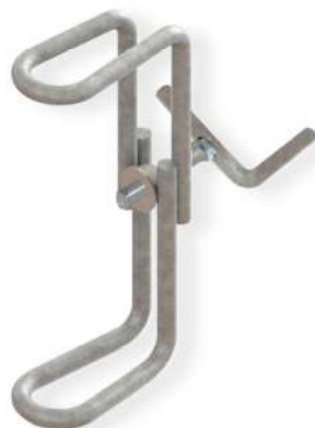
Coulisseau simple fil acier galvanisé diam. 12 mm, 1 manette de serrage.