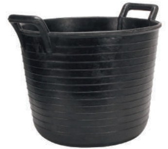
ESPUERTA RUBBER BASKET N°99 (33 l) REF.88804