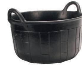
CARBONERA RUBBER BASKET N°2 (30 l) REF.88902