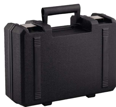
Livré dans sa valise de transport