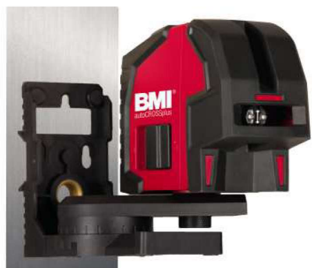
Support multifonctions magnétique