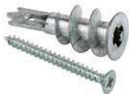
Fixation métallique pour carton-plâtre GKM-SF vis à tête fraisée pour plaque de plâtre