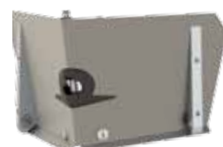
CF40TT - Lisseur d'angle de 10 cm