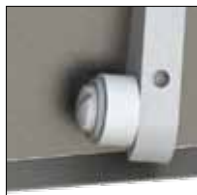
CFK01TT - Kit de rouleau