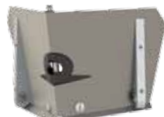
CF35TT - Lisseur d'angle de 8,9 cm