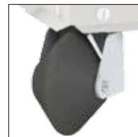
CFK02TT - Kit de roue à strier