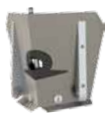
CF25TT - Lisseur d'angle de 6,3 cm

Les lisseurs d'angle de TapeTech permettent d'essuyer ou de finir rapidement les angles intérieurs. Des lisseurs directs sont utilisés pour appliquer de la pâte à joint dans les coins intérieurs. Les lisseurs indirects lissent simplement la pâte à joint qui a été appliquée par un autre outil. Les lisseurs de TapeTech servent à la fois de lisseurs directs et de lisseurs indirects. Cela signifie que vous n'avez pas besoin de décider quel modèle acheter – seulement quelle taille est appropriée à vos besoins. Les lisseurs d'angle sont compatibles avec tous les outils d'angle de TapeTech (les manches 88TTF et HF, les applicateurs d'angle 35TT et 50TT et le MudRunner® 14TT).