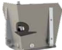
CF30TT - Lisseur d'angle de 7,5 cm