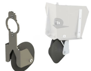
CFK02TT Kit de roue à strier UPC: 873876002283

La roue à strier pousse la bande dans le coin en même temps que le lisseur d'angle essuie la pâte à joint. (Lisseur d'angle non inclus)